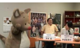
NHK福岡放送局との連携で!